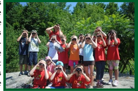
Cocci et ses amis observent les oiseaux!!!

L'été nous a fait vivre une dernière canicule, mais les signes de l'arrivée prochaine de l'automne commencent à se manifester. Nos camps de jour se sont terminés en beauté avec près de 400 enfants participant à une semaine d'activité au mont Saint-Grégoire. Dans le verger, plusieurs variétés de pommes sont déjà prêtes, hâtez-vous, la saison est en avance. Le calendrier des réservations des écoles pour les excursions et les ateliers en classe se remplit au rythme de la rentrée scolaire. La fréquentation des sentiers est encore en hausse. Pour l'automne, saison fort achalandée, nous vous