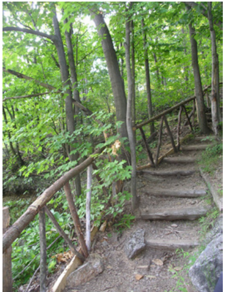
Un sentier bien aménagé canalise les visiteurs et minimise l'érosion

Le mont Saint-Grégoire est l'un des derniers boisés de 200 hectares et plus dans la région. Il constitue donc un écosystème forestier peu fragmenté, essentiel au maintien de la biodiversité. CIME s'est donné pour mission de protéger à perpétuité ce refuge pour la faune et la flore. Ainsi, l'aménagement de sentiers est conçu de façon à réduire l'impact des visiteurs sur le milieu naturel : marches de terre et barres d'eau pour contrôler l'érosion, rampes de bois et cordes pour délimiter les sentiers, signalisation et panneaux d'information. En acquittant son droit d'accès et en demeurant dans le réseau de sentiers de CIME, le visiteur pose un geste concret pour l'environnement. Il s'assure aussi que l'accès à la montagne sera maintenu, afin que tous profitent de ce havre de paix pour les plantes et les animaux.