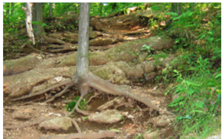
Destruction de la végétation, érosion et mise à nu des racines, sont bien visibles dans ce sentier non aménagé

Il ne suffit que de quelques passages répétés au même endroit pour piétiner la végétation et ainsi créer un nouveau sentier. Lorsqu'il est visible, un sentier « pirate » attire d'autres visiteurs et devient de plus en plus passant. Les impacts s'intensifient : destruction de la litière organique qui protège le sol, compaction, érosion, mauvais égouttement qui crée des flaques de boue et qui conduit, inévitablement, à l'élargissement du sentier.